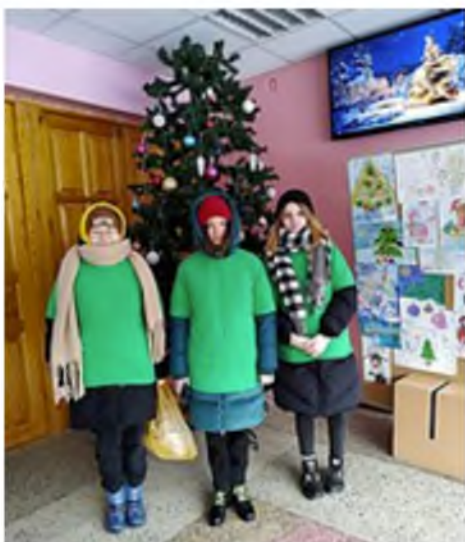
Старт от школьной елки.

Помимо этого в нашей школе стартовала традиционная акция "Новогодье", которая проводится в срок с 6 по 24 декабря. Были изготовлены новогодние открытки, которые вручались пожилым людям накануне праздника. Подари радость и тепло окружающим!