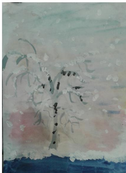
Работы учащихся 3 А класса