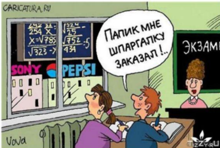
«Рюкзак» Елена Дюк

Это так клево - проснуться часов в 7, вспомнить, что сейчас каникулы, и спать дальше до 11... Вот и начались каникулы! Время, когда не знаешь, какое число и какой день недели!